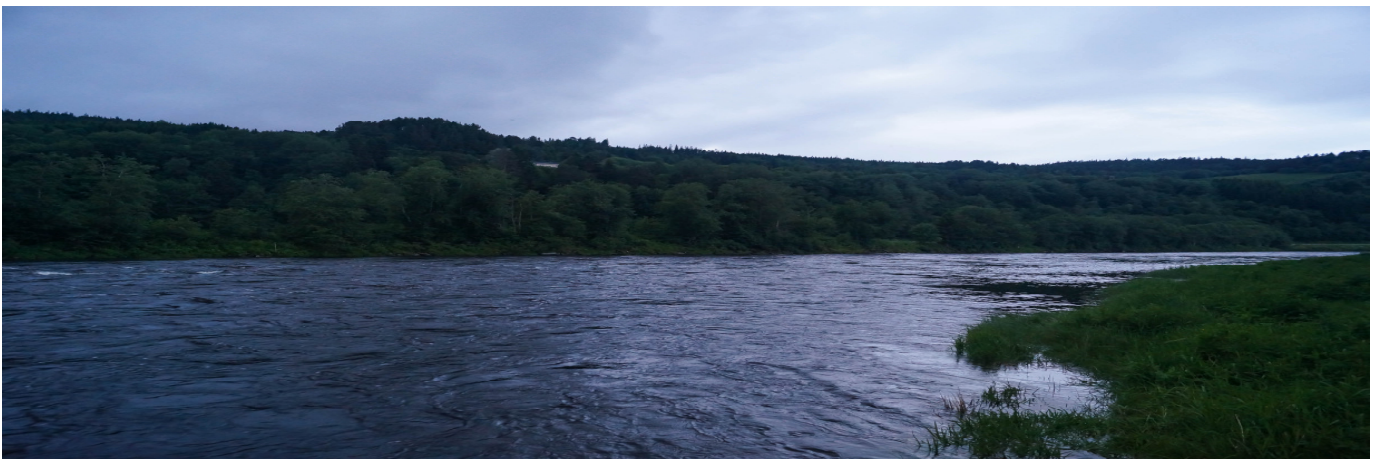
Abends am Arnt-Pool

Nach den Aussagen der Angler an den weiter flussabwärts gelegenen Pools, sind kaum Lachse aufgestiegen bzw. gefangen worden.