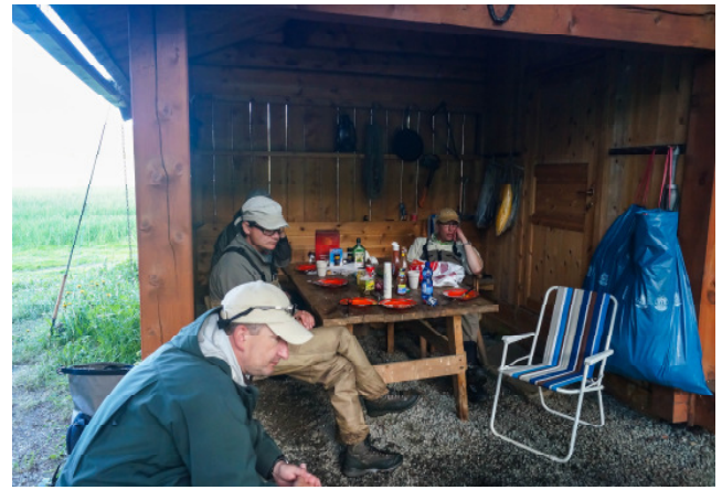
.....täglich wurde dort gegrillt