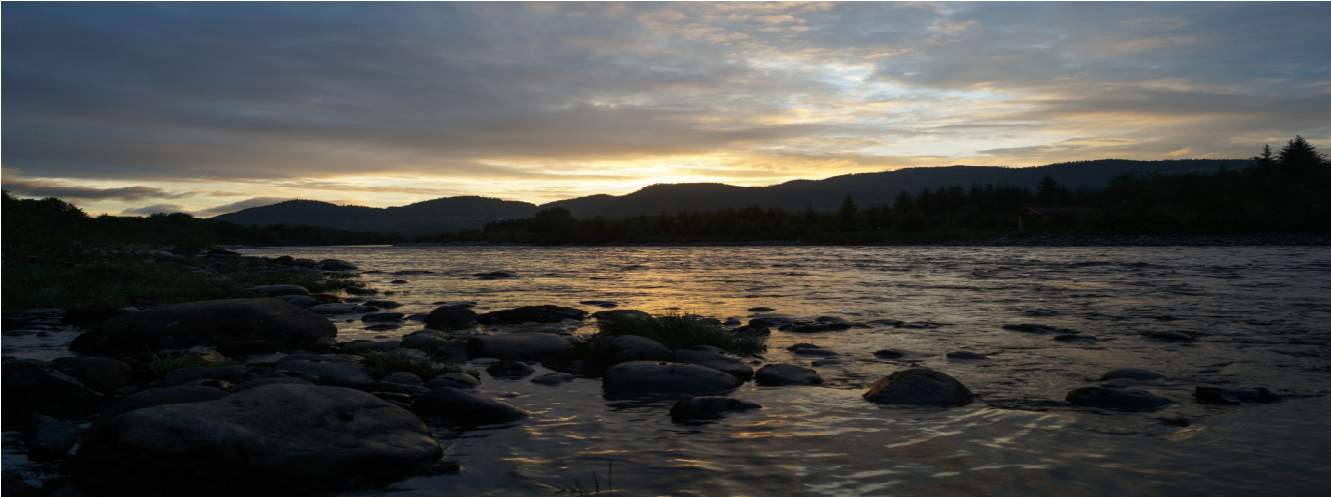
Sonnenaufgang am Liehølen